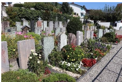
Evangelischer Friedhof Balgach Grabesruhe: 20 Jahre