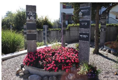
Evangelischer Friedhof Balgach Grabesruhe: 20 Jahre