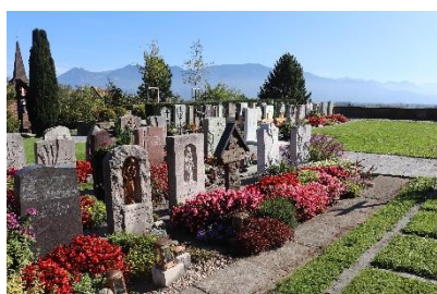
Katholischer Friedhof Balgach Grabesruhe: 15 Jahre