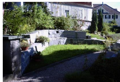
Evangelischer Friedhof Balgach