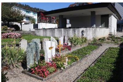
Evangelischer Friedhof Balgach Grabesruhe: 20 Jahre