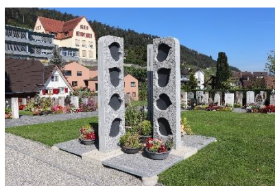
Katholischer Friedhof Balgach Grabesruhe: 10 Jahre