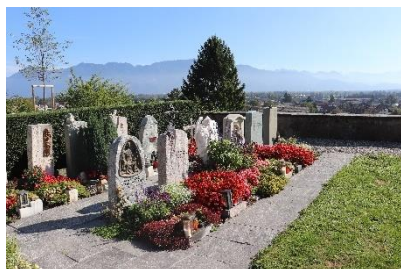
Katholischer Friedhof Balgach Grabesruhe: 20 Jahre