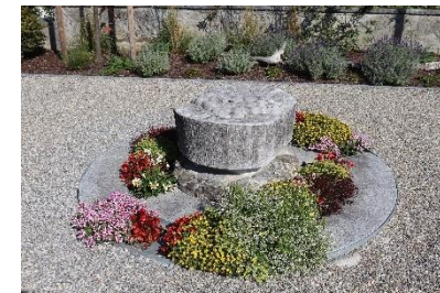
Katholischer Friedhof Balgach

In der evangelischen und katholischen Friedhofverordnung (beim Bestattungsamt erhältlich) finden Sie nähere Auskünfte über die verschiedenen Grabarten, die Grabesruhe sowie die Vorschriften über Beschriftung der Grabsteine sowie die Bepflanzung der Grabstätten.